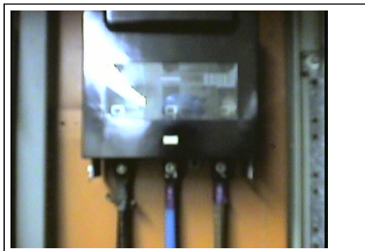
Defekter Anschluss an einem NH – Sicherungslasttrenner Normalbild von BL Automation

Auf Grund einer losen Anschlussverbindung an einem NH – Sicherungslasttrenner wurde Kabelanschluss unzulässig hoch erwärmt (> 180 °C).